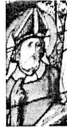
St Projet ou st Prix

XIII-XV èmes siècles : construction de la nef, la chapelle adjacente, la porte en ogive, le clocher mur aux 2 baies.