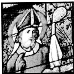
Saint Projet (vitrail de l'église St Projet-St Amarin, à Raedersheim, Haut-Rhin)