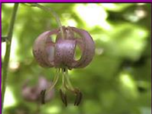
Le Lis martagon