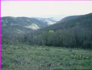
La vallée du Bonnan

Rendez-vous au parking de Milhars à 9 h - 12 km - durée 7 h - 16 Euros / P amener le pique-nique.