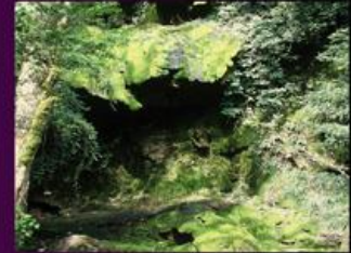
La cascade de tuf calcaire