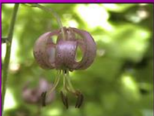
Le Lis martagon